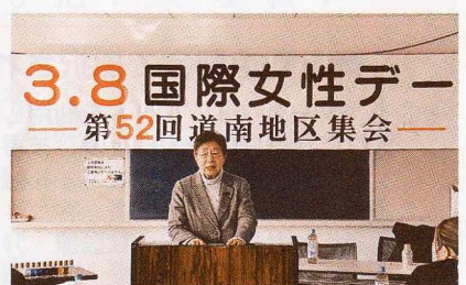
3.8 国際女性デー集会