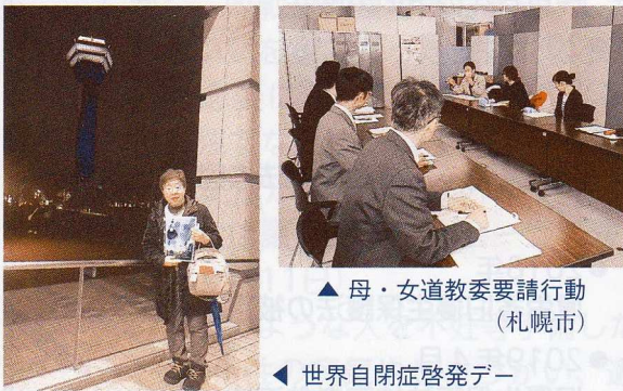
母・女道教委要請行動 (札幌市)