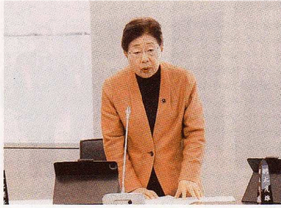
2025. 3. 17 エネ特別委員会質問