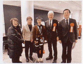
函館消防出初め式