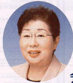
北海道議会議員 平出陽子