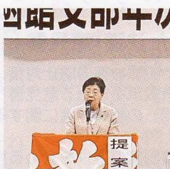
北教組函館支部 年次大会

あとがき 今議会において、旧優生保護法における道の対応について実態が明らかになりました。病氣やしうがいのある方々に対して、強制的に不妊手術を促し、子どもが産めない身体にした事実はありません。ハンセン病の時にも「無らい県運動」として患者を道外の施設に強制入所させました。人権侵害は、間違った見識や理解不足、多数の声に判断できず、自分の周りから排除させてしまう感覚であると言われています。同じ過ちを二度と繰り返さないこと、誤りに気づくこと、気づいたら改めること、それらが私たちに課された使命であるはずす。