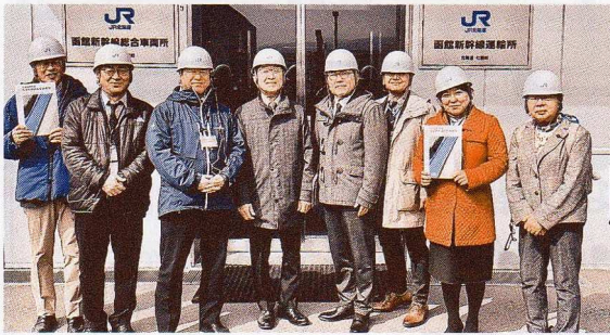
北海道新幹線車両所視察 (七飯町)