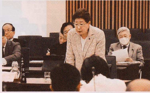
2025. 3. 12 予算特別委員会質問