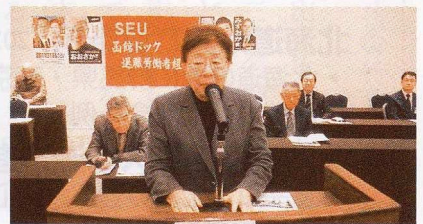
函館ドック退職労働者組合定期総会

あとがき 今議会において、旧優生保護法における道の対応について実態が明らかになりました。病氣やしうがいのある方々に対して、強制的に不妊手術を促し、子どもが産めない身体にした事実はありません。ハンセン病の時にも「無らい県運動」として患者を道外の施設に強制入所させました。人権侵害は、間違った見識や理解不足、多数の声に判断できず、自分の周りから排除させてしまう感覚であると言われています。同じ過ちを二度と繰り返さないこと、誤りに気づくこと、気づいたら改めること、それらが私たちに課された使命であるはずす。