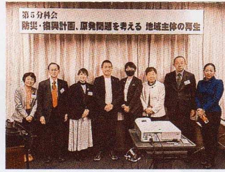
全国地方議員交流研修会 (那覇市)