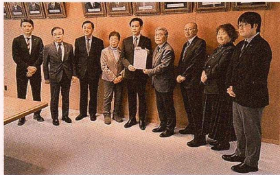
▲ 2025年度予算函館市長要請