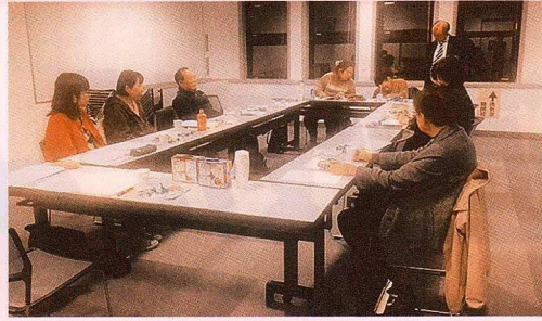
▲ インクルーシブ教育研修会 (しょうがい児も普通学校へ)