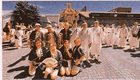
▲ 函館八幡宮みこし渡御